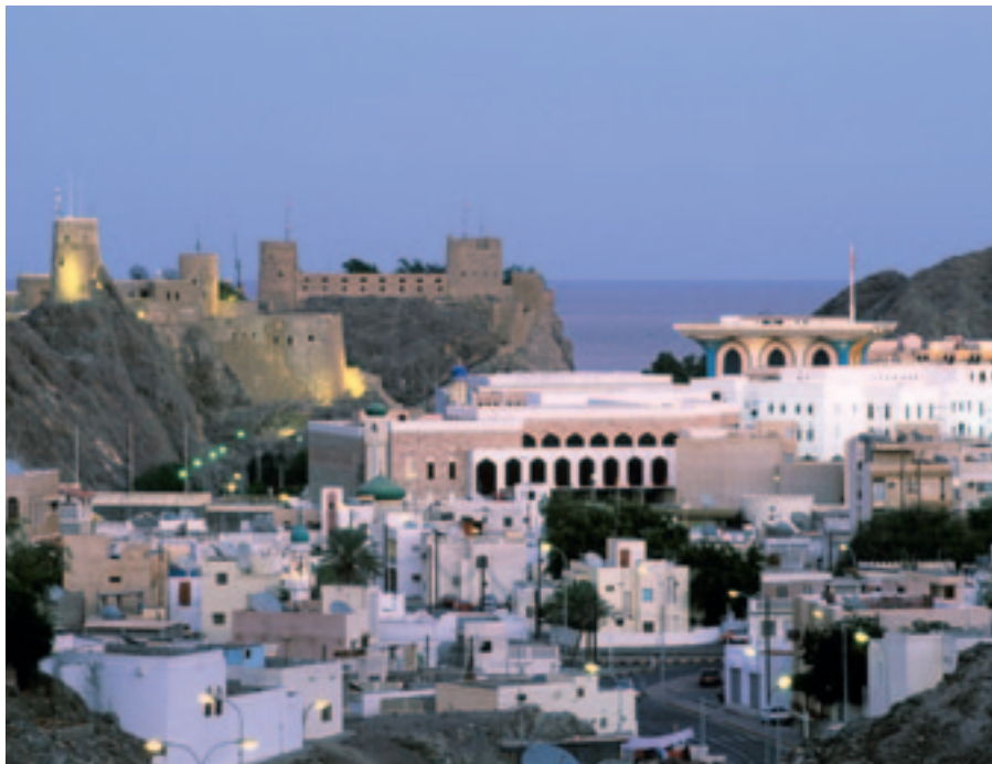
Welten liegen zwischen der Idylle (aus 1001 Nacht) in Muscat ...