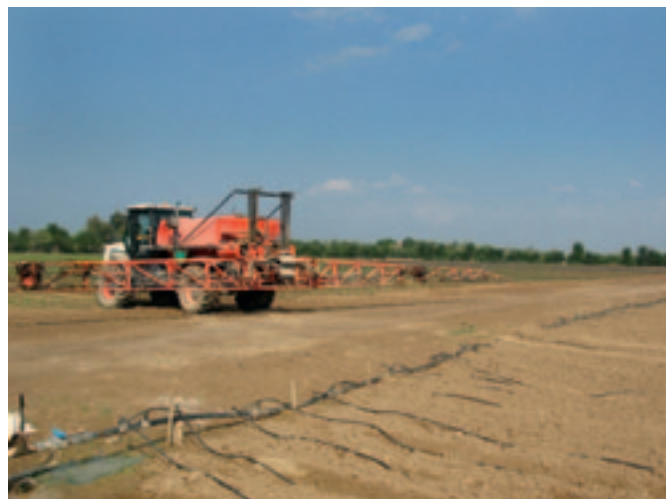
Modernste Bewässerungs- und Pflanzenschutztechnik