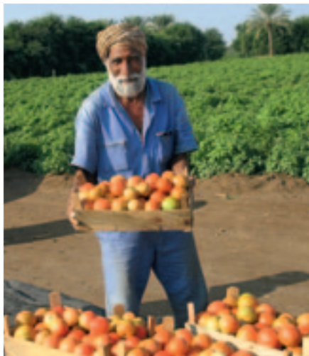
Eine von vielen faszinierenden Begegnungen.

Das Programm ist zusammen mit Vertretern des SVLT speziell für seine Mitglieder ausgesucht worden. Reiseveranstalter ist TUI Suisse Ltd.