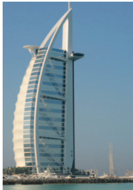
... und der grazilen Architektur trotz Gigantismus in Dubai.

Busfahrt nach Birkat al Mouaze (ca. 145 km von Muscat entfernt). Besichtigung eines Kleinbauernbetriebs mit Dattelproduktion. Anschliessend Weiterfahrt hinauf auf 2000 m ü.M. nach Jebel Akhdar, was «Grüner Berg» heisst. In den Obstgärten und den ausgedehnten Terrassenfeldern dieser Gegend gedeihen Mais, Granatäpfel, Aprikosen, Pfirsiche, Mandeln, Walnüsse, Weintrauben und Rosen, aus denen das berühmte und teure Jebel-Akhdar-Rosenwasser hergestellt wird. Weiterfahrt nach Nizwa (Übernachtung).