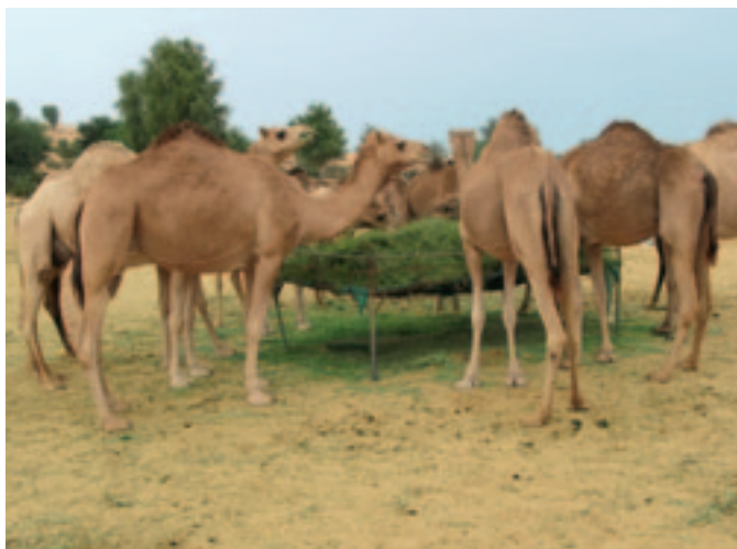
Das Kamel: Transportmittel sowie Milch- und Fleischlieferant